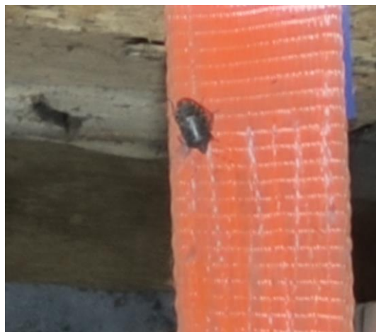
foto van boosdoener, gemaakt door arbeider

De balk, bevestigd in de muur, is aan het uiteinde rot geworden door vocht én het knaagdier. Het wordt verwijderd en dan ontstaat er ruimte om vol te gieten met een combinatie van epoxyhars, zand, kiezel en staal.