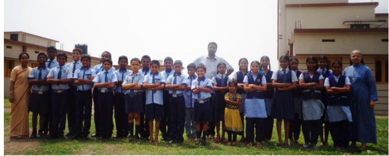
De eerste groepen kinderen in schooluniform; september 2015

Met de gelden van Vastenactie 2015 wordt het laatste deel (centrale keuken, was- en afwasvoorzieningen, studie ruimten, recreatie ruimten, verblijfsruimten) gebouwd. Op bijgaande foto ziet u de eerste groep kinderen poserend, augustus 2015, tussen de twee woonvleugels.