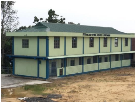
STS PETER & PAUL HOSTEL LAITKYNSEW

Een duidelijker beeld van het hostel = internaat, waar momenteel 40 jongens verblijven. Zij komen uit de verst afgelegen dorpen en verblijven op het terrein van de missie : school en internaat. De naam van het hotel is zichtbaar :