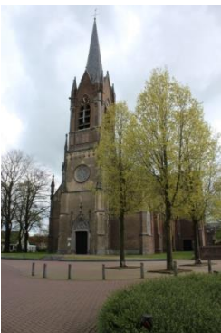
H. Luciakerk, Mierlo