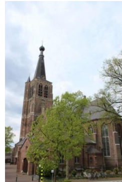
H. Petrus' Bandenkerk Leende