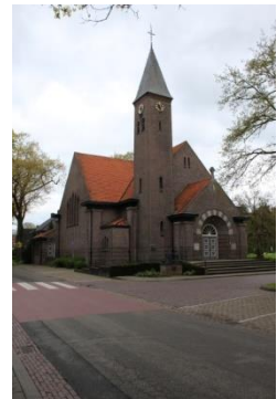
H. Catharina van Alexandriëkerk Sterksel