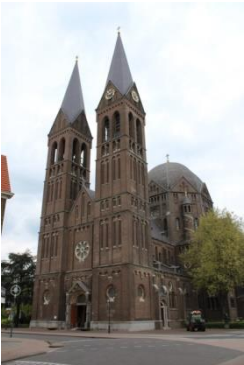
H. Brigidakerk Geldrop

Er ligt een folder in de kerk – ook te zien op de website van de Nicasiusparochie – waarin het programma van de andere kerkgebouwen in onze parochie te vinden is. Al de kerkgebouwen van de Nicasiusparochie zijn geopend, er zijn kerkgidsen aanwezig en ook de pastores staan de bezoekers te woord.