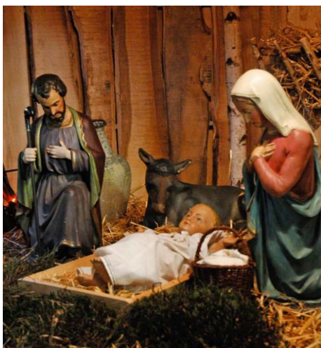
kerststal in onze kerk