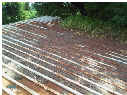
HET LEKKENDE DAK VAN DE VERPLEEGSTERSFLAT IN MANDISI MALAWI