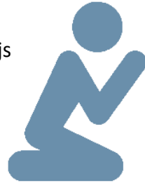
Boete en verzoening

Om ons innerlijk voor te bereiden op Kerstmis wordt ons op dinsdag 18 december om 19.00 uur een boete- en biechtviering aangeboden. Aansluitend aan de boeteviering is er gelegenheid voor hen die dat op prijs stellen om persoonlijk het sacrament van Boete en Verzoening te ontvangen. In verband met deze voorbereidingsplechtigheid zal de avondmis van die dinsdag verplaatst worden naar de ochtend, aansluitend aan het ochtendgebed in het St. Antoniushuis. Van harte welkom!